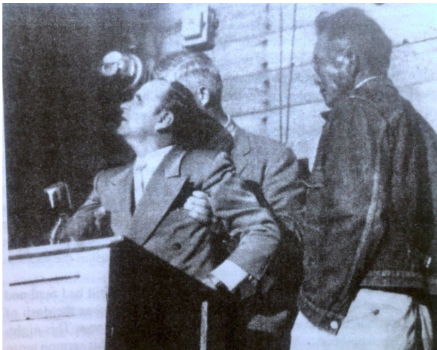
William Branham sa potáca pod pomazaním, zatiaľ čo slúži v rezervácii Apačov v San Carlos

Misionár zašiel do misijnej budovy a priviedol so sebou niekoľkých pomocníkov, ktorí súhlasili s tým, aby sa postavili do modlitebného radu. Ako prvá prišla indiánska žena s nosičom priviazaným na chrbte. Žena nevedela po anglicky. Akonáhle Bill zobral jej pravú ruku do svojej ľavej, pocítil silu démonického vibrácie. Opačná strana jeho ruky sčervenala a opuchla a na koži sa pohybovali biele podliatiny. Bill povedal do mikrofónu, „Tá pani má pohlavnú chorobu.“